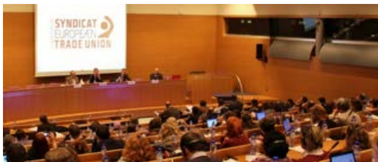
Prva evropska konferenca sindikalnih kontaktnih točk za migrante

Mreža UnionMigrantNet je glavni rezultat projekta „A4I-ETUC – Pobuda Evropske konfederacije sindikatov za oblikovanje evropske mreže pomoči za integracijo delavcev migrantov in njihovih družin“. Projekt, ki ga je prek Evropskega sklada za vključevanje sofinanciral Generalni direktorat za notranje zadeve, se je začel decembra 2013, končal pa se bo julija 2015. Affairs started in December 2013 and will end in July 2015.