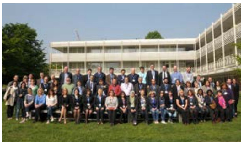
Konferenca za oblikovanje mreže A4I-ETUC

Pri vzpostavitvi mreže UnionMigrantNet so od decembra 2013 sodelovale vse članske organizacije Evropske konfederacije sindikatov. Med prvo evropsko konferenco sindikalnih kontaktnih točk za migrante si je približno 150 sindikalnih predstavnikov zadalo cilj, da sindikalne kontaktne točke za migrante povežejo v enotno evropsko mrežo.